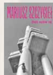
Mariusz Szczygieł – Zrób sobie raj

To miał być banalny zabieg chirurgiczny, ale pacjentka, pielęgniarka miejscowego szpitala umarła niepodziewania na stole operacyjnym. O błąd w sztuce zostaje oskarżona anestezjolog. Wynajęty przez rodzinę zmarłej adwokat, jest całkowicie przekonany o winie lekarki. Gdy w tajemniczych okolicznościach ginie kolejna pielęgniarka, staje się jasne, że anestezjolog – Kate jest niewinna, a morderca wybiera swoje ofiary wśród pracowników szpitala. Adwokat wspólnie z oskarżoną anestezjolog rozpoczynają własne śledztwo.