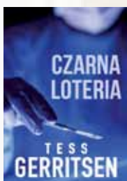
Tess Gerritsen – Czarna loteria