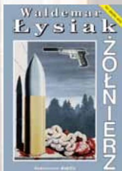
Waldemar Łysiak Żołnierz

Bohaterem najnowszej sensacyjno-refleksyjnej powieści Waldemara Łysiaka jest porucznik Legii Cudzoziemskiej, którego młodszy brat - ochroniarz zaginął podczas strzelaniny między członkami dwóch gangów. Ekslegionista postanawia spojrzeć sprawcom śmierci w oczy. A ściślej: między oczy.