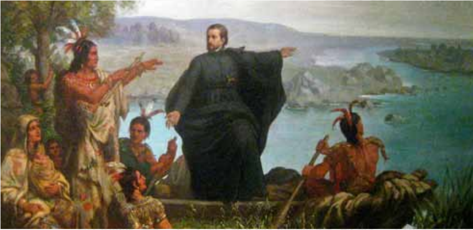
Père Marquette i Indianie - Wilhelm Lamprecht / 1869 / olej na płótnie