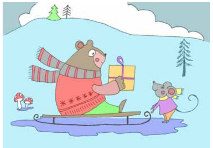
rys. Joanna Krawczyk