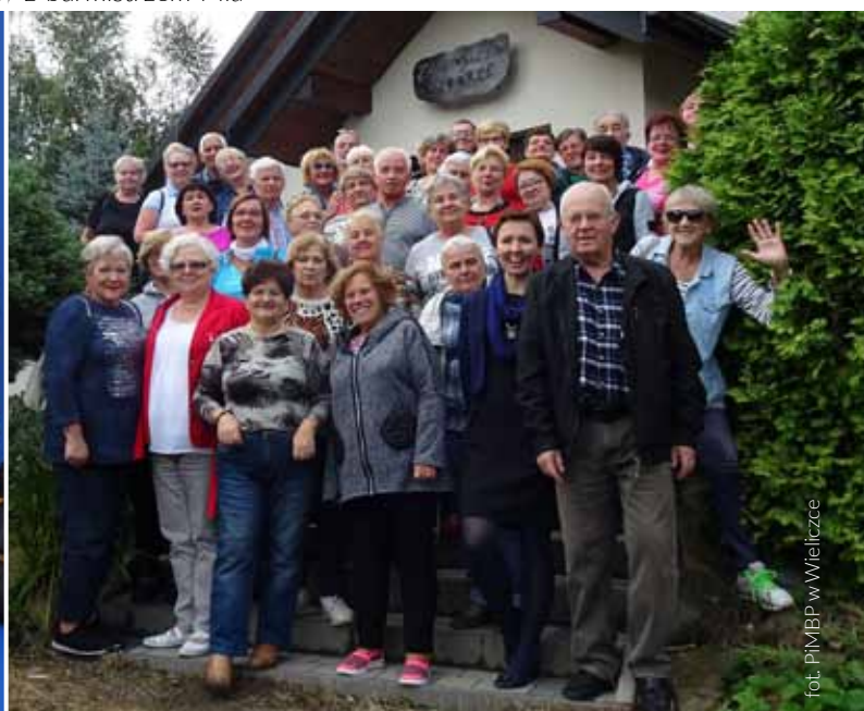
fol. PiM/BP w Wieliczce