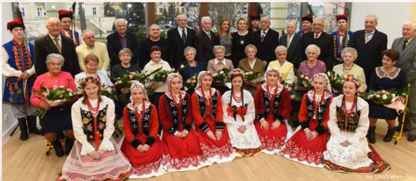
fol. UMiG Wieliczka