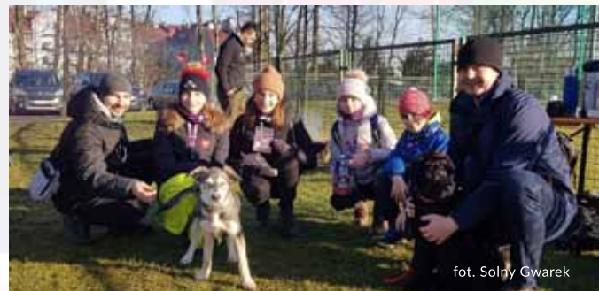
fol. Solny Gwarek