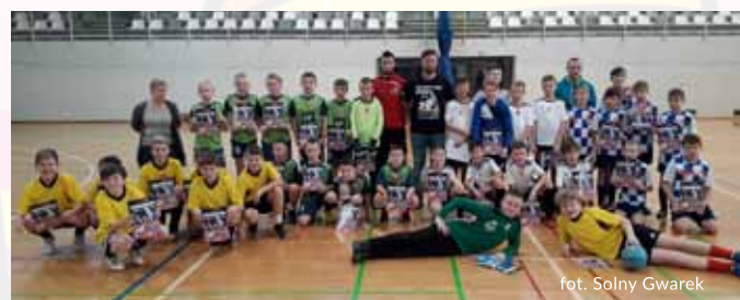
fol. Solny Gwarek