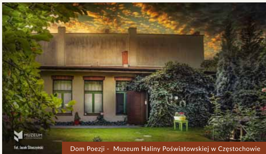
Dom Poezji - Muzeum Haliny Poświatowskiej w Częstochowie

Poświatowska, „Poezje zebrane”, Toruń 1994, wydanie pierwsze; Szułczyńska, „Nie popełniłam zdrady”. Rzecz o Halinie Poświatowskiej, Kraków 1990, s. 24, 108; „Poezja 1985 nr 2, numer poświęcony w całości Halinie Poświatowskiej; Słownik poetów polskich; Wydawnictwo Łuk, Białystok 1997