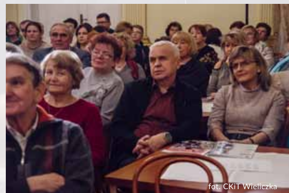
fol. CKiT Wieliczka