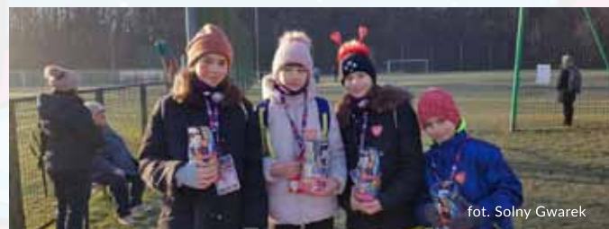
fol. Solny Gwarek