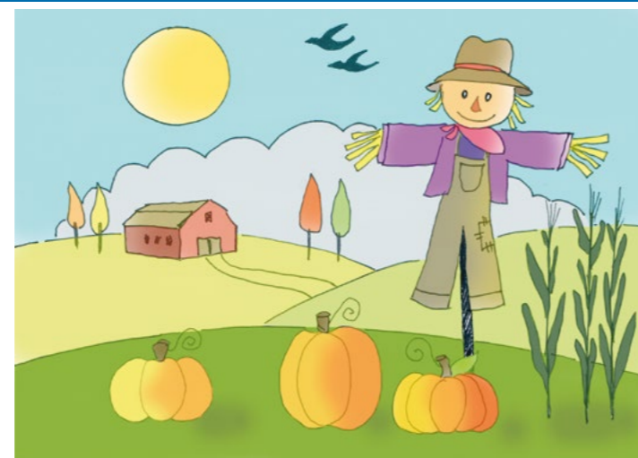
rys. Joanna Krawczyk